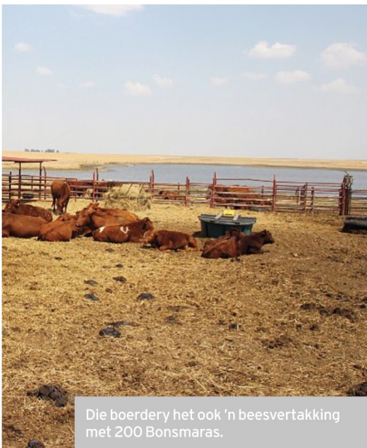
Die boerdery het ook ’n beesvertakking met 200 Bonsmaras.

“Die syfer het met 2% verlaag. Verskeie faktore speel ’n rol, maar ek dink Aviboost Poultry Tonic se rol is die grootste. Dit is onvervangbaar op die plaas.”