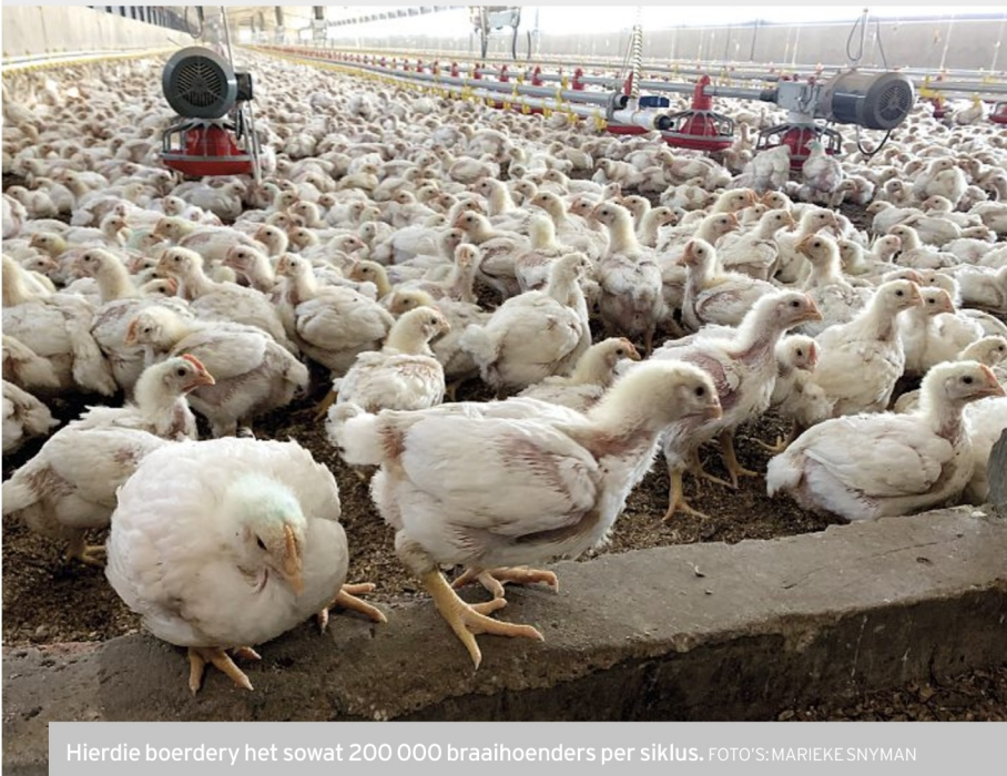
Hierdie boerdery het sowat 200 000 braaihoenders per siklus.